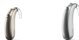
Naída P-PR Naída P-PR Trial